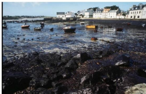
La marée noire