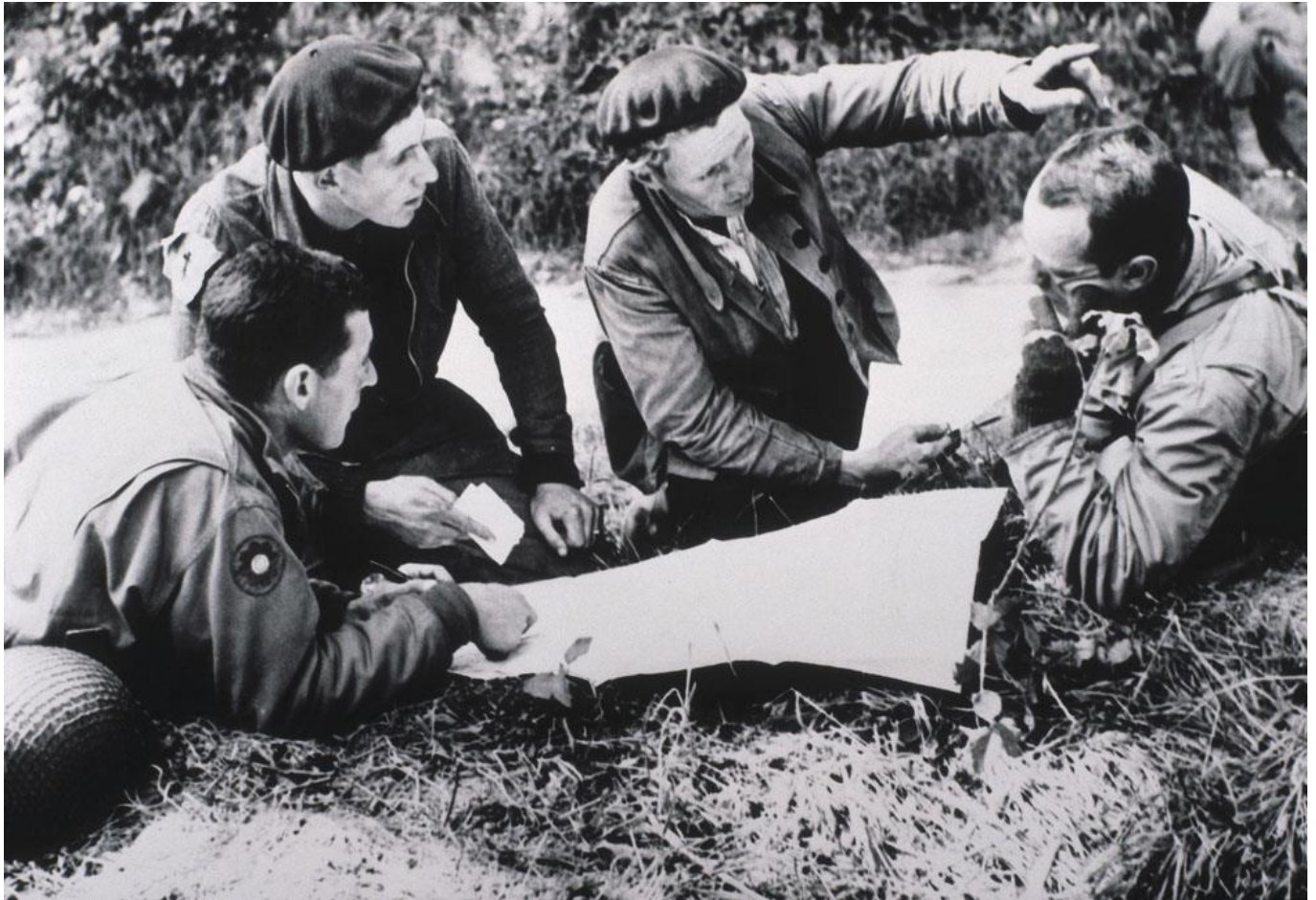
Des résistants dans un maquis