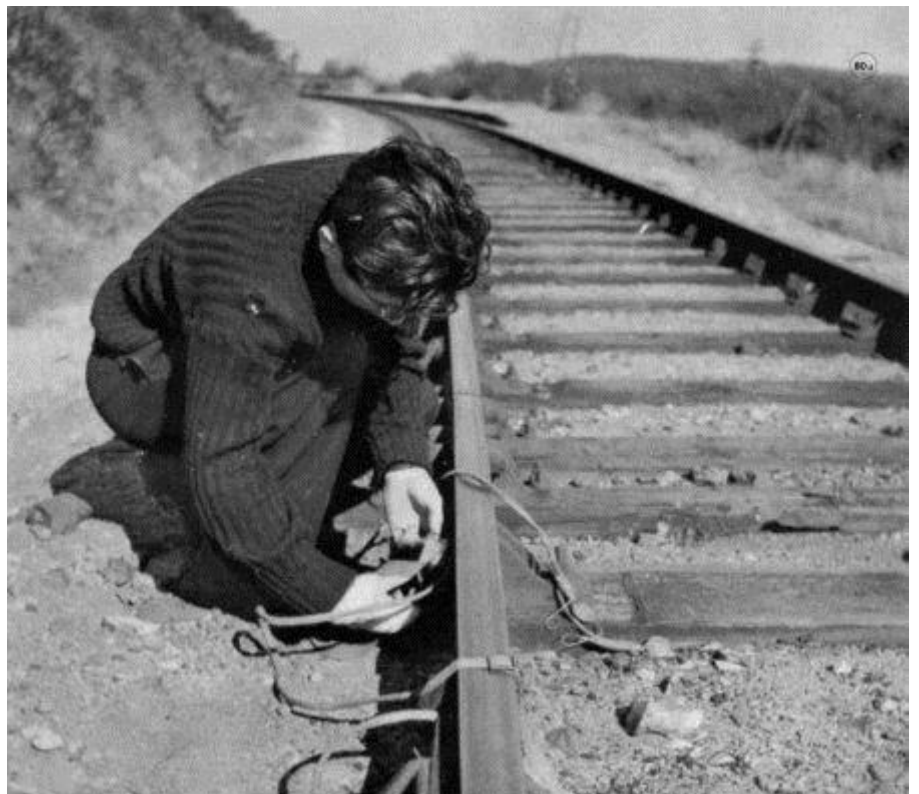
Préparation d'un sabotage